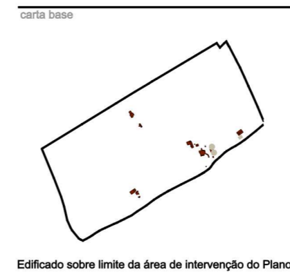
Edificado sobre limite da área de intervenção do Plano

plano Plano de Pormenor da UOPG10 do Plano de Urbanização da Meia Praia Arq.ª Mónica Martinez Eng.º João Costa